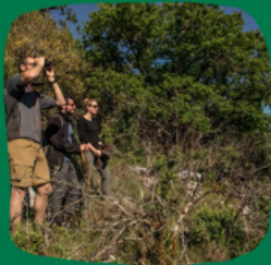
Suivi ornithologique dans le Lot

1 906 hectares conventionnés depuis le début du projet !