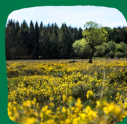
Tourbière de Canroute dans le Tarn

115 hectares acquis depuis le début du projet ! + 91ha qui vont recevoir des actions de gestion grâce au projet